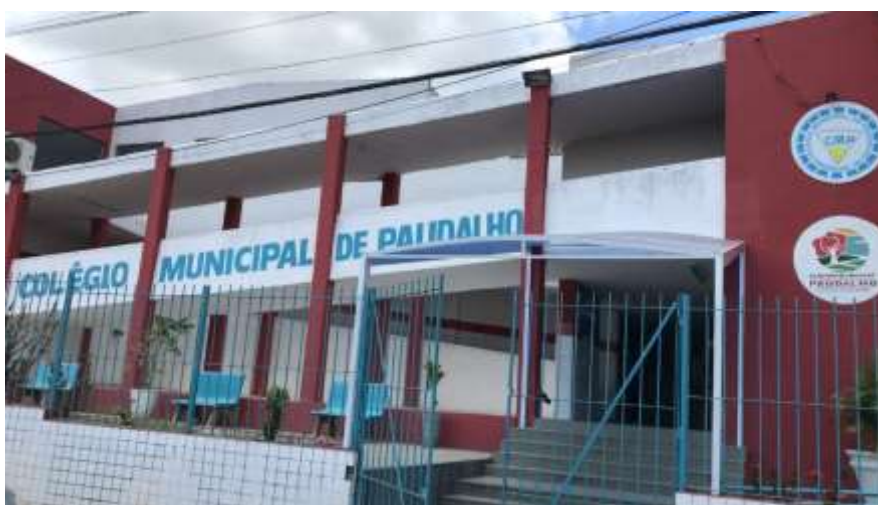
Imagem 1: Frente da escola

O Colégio Municipal do Paudalho foi fundado em janeiro de 1969, inicialmente chamado de Ginásio Municipal do Paudalho. Está localizado no centro da cidade, área urbana do município de Paudalho, Mata Norte da Região do Estado de Pernambuco (Imagem 1).