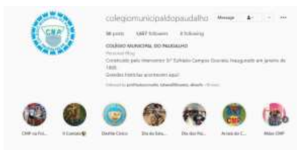
Imagem 2: Perfil do instagram do colégio

A escola possui um excelente número de seguidores no perfil do instagram. Contanto com o engajamento dos alunos, ex alunos, famílias e educadores (imagem 2).