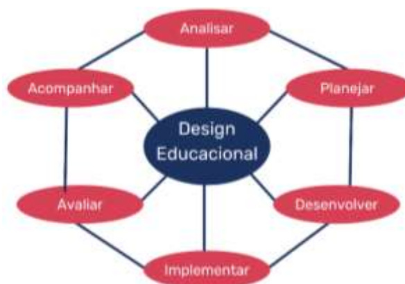
Figura 1: Pilares do Design Educacional

O programa tem o objetivo de levar formação inicial e continuada em temas inovadores, como: tecnologia, metodologias ativas e interativas, entre outros. Este relatório estará pautado no modelo de “Design institucional” (MATTAR, 2014), que estabelece a criação e o planejamento de projetos pedagógicos que são auxiliados por recursos virtuais. Seguindo os pilares descritos na figura abaixo.